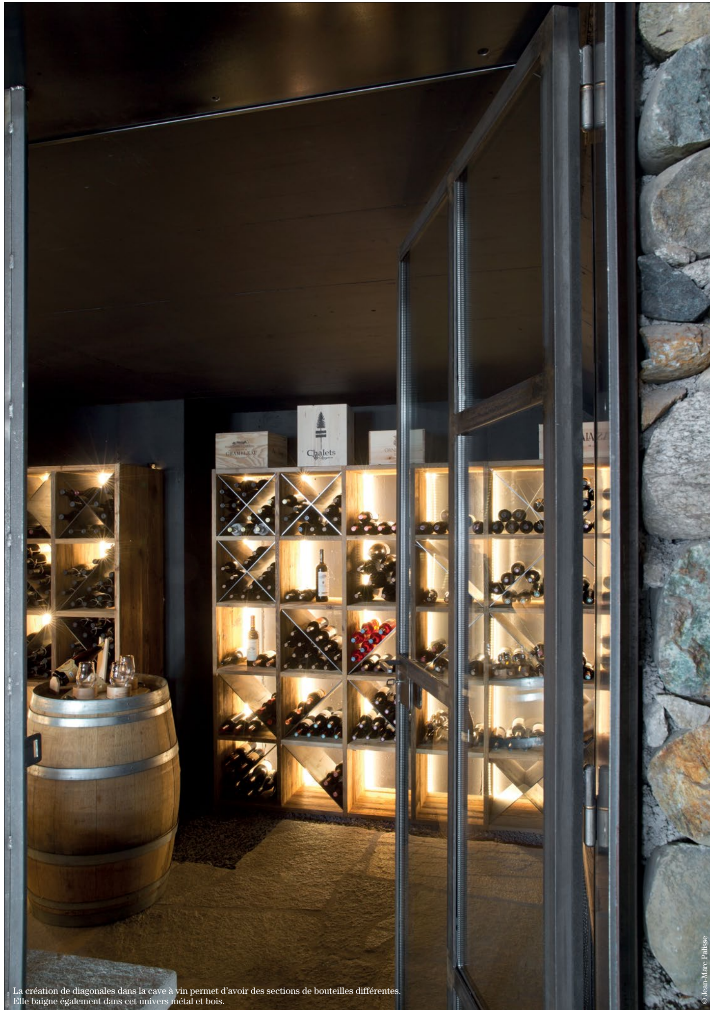
La création de diagonales dans la cave à vin permet d'avoir des sections de bouteilles différentes. Elle baigne également dans cet univers métal et bois.