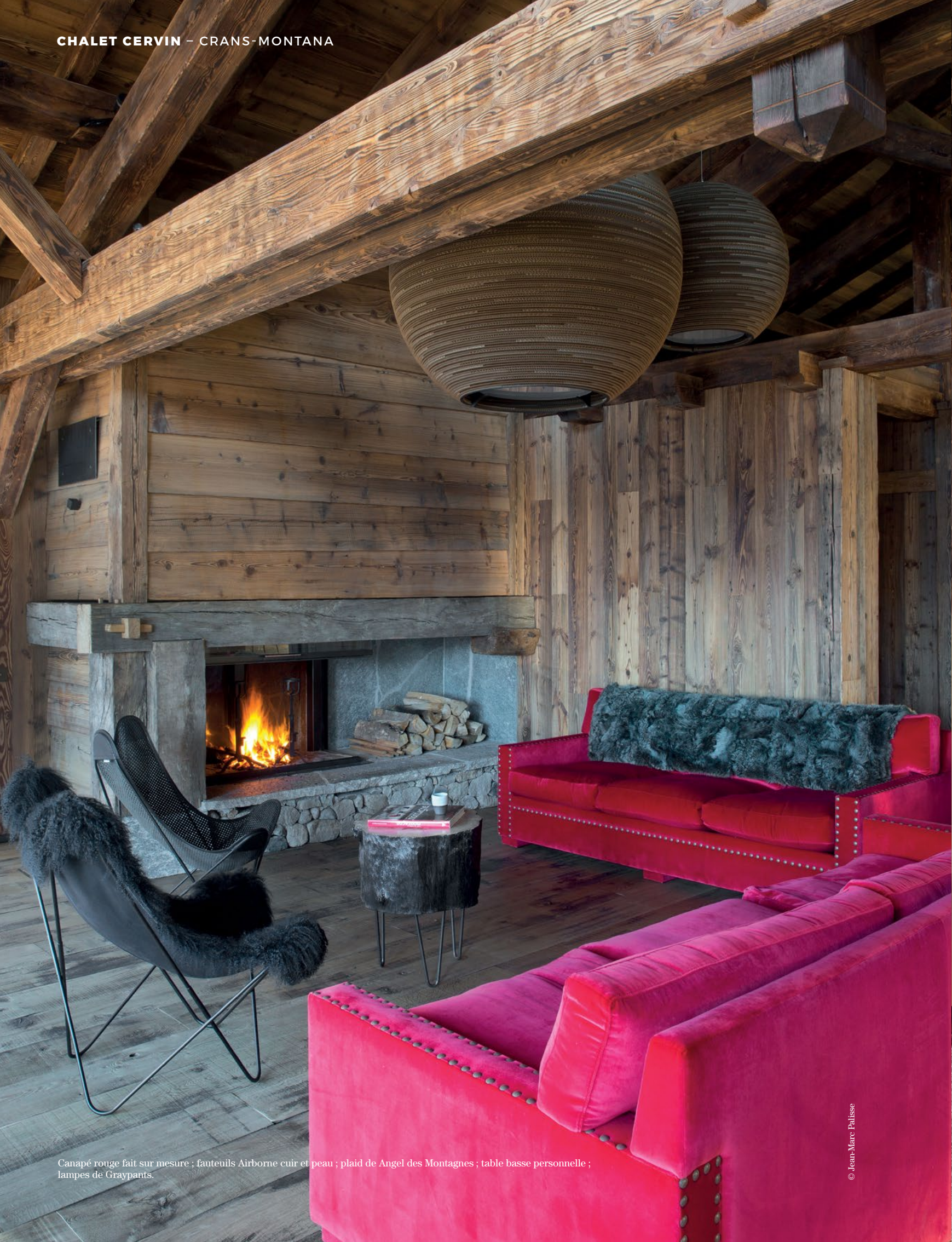
Canapé rouge fait sur mesure ; fauteuils Airborne cuir et peau ; plaid de Angel des Montagnes ; table basse personnelle ; lampes de Graypants.