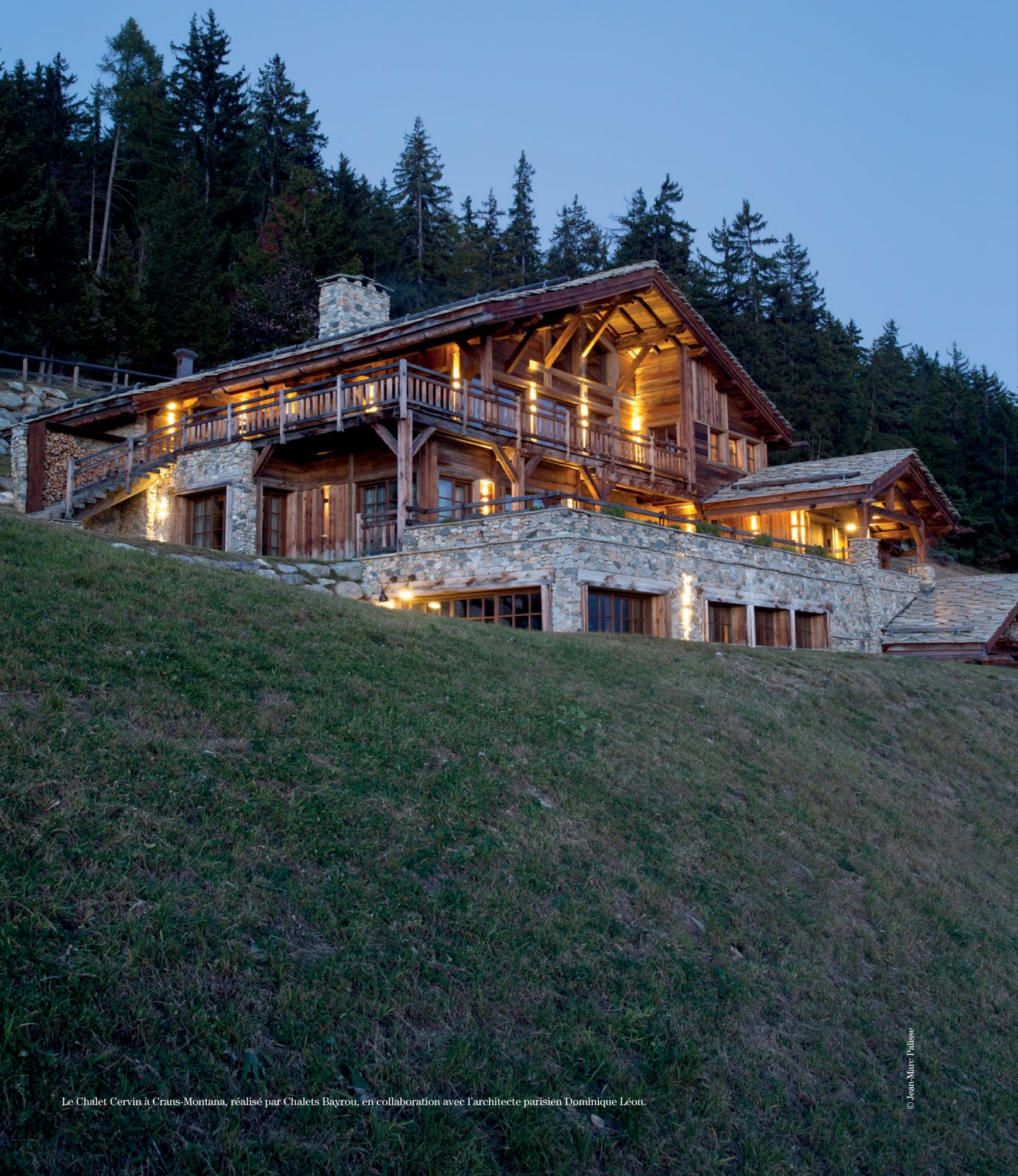
Le Chalet Cervin à Crans-Montana, réalisé par Chalets Bayrou, en collaboration avec l'architecte parisien Dominique Léon.