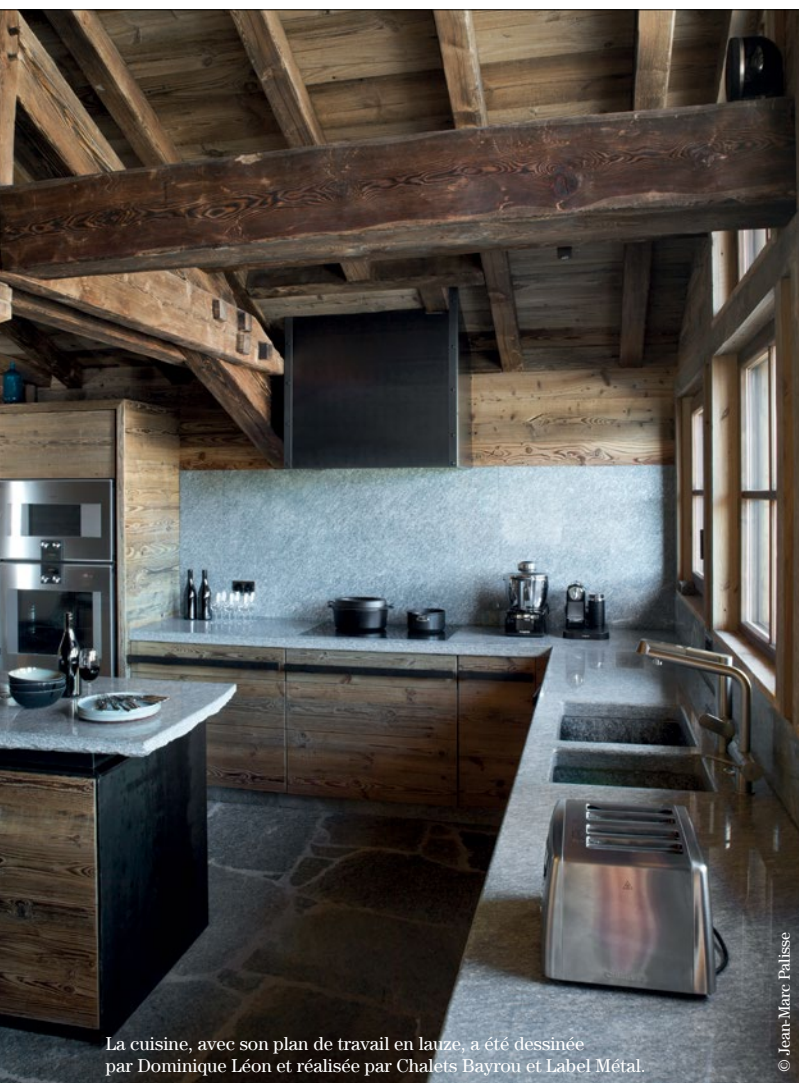
La cuisine, avec son plan de travail en lauze, a été dessinée par Dominique Léon et réalisée par Chalets Bayrou et Label Métal.