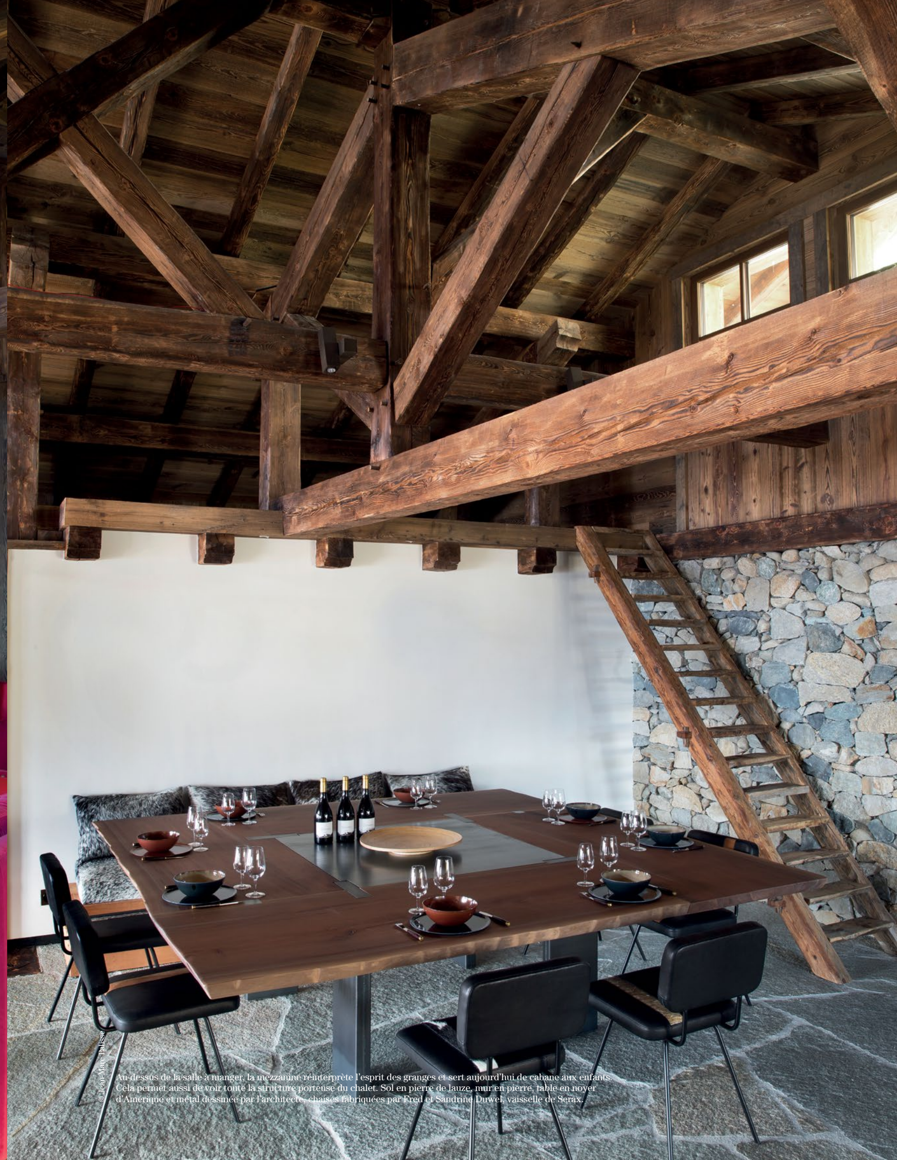
Au-dessus de la salle à manger, la mezzanine réinterprète l'esprit des granges et sert aujourd'hui de cabane aux enfants. Cela permet aussi de voir toute la structure porteuse du chalet. Sol en pierre de lauze, mur en pierre, table en noyer d'Amérique et métal dessinée par l'architecte, chaises fabriquées par Fred et Sandrine Duwel, vaisselle de Serax.