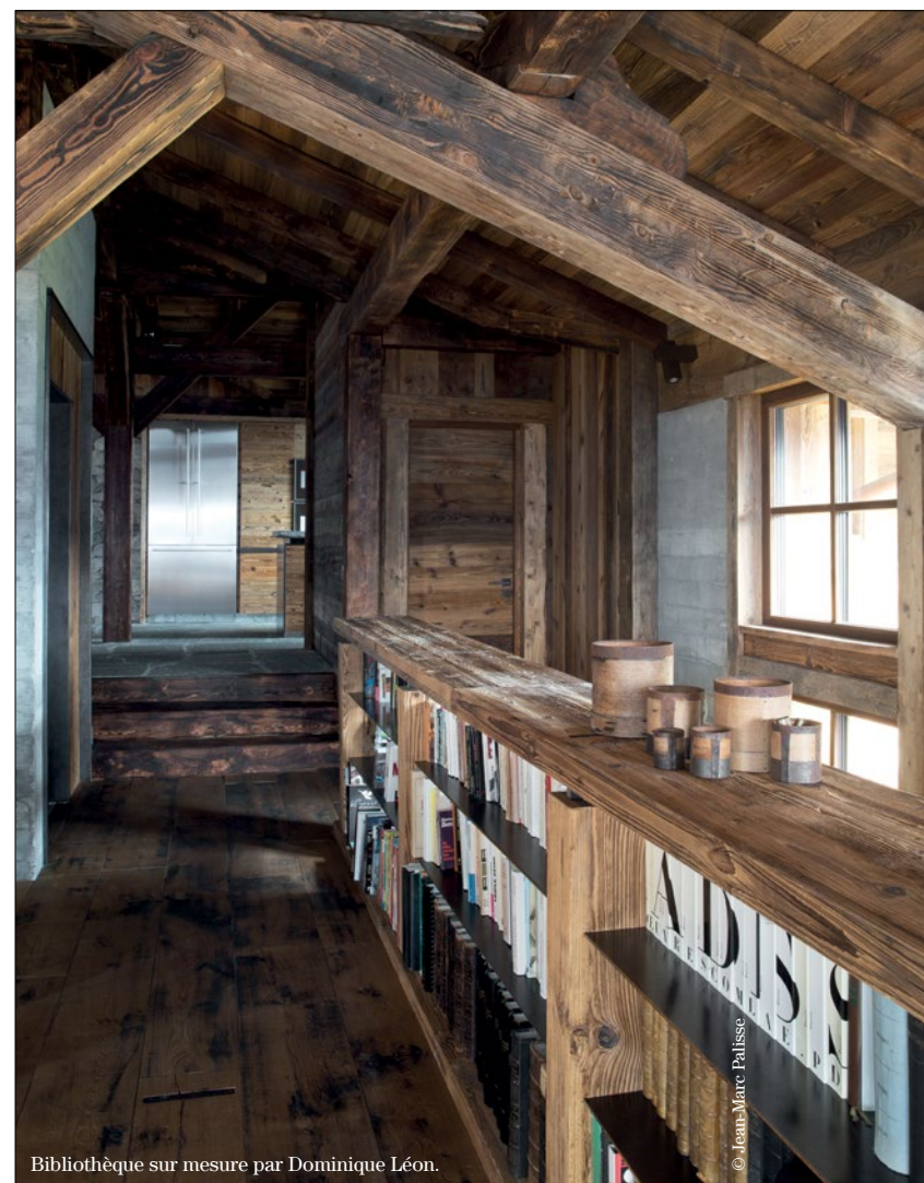
Bibliothèque sur mesure par Dominique Léon.