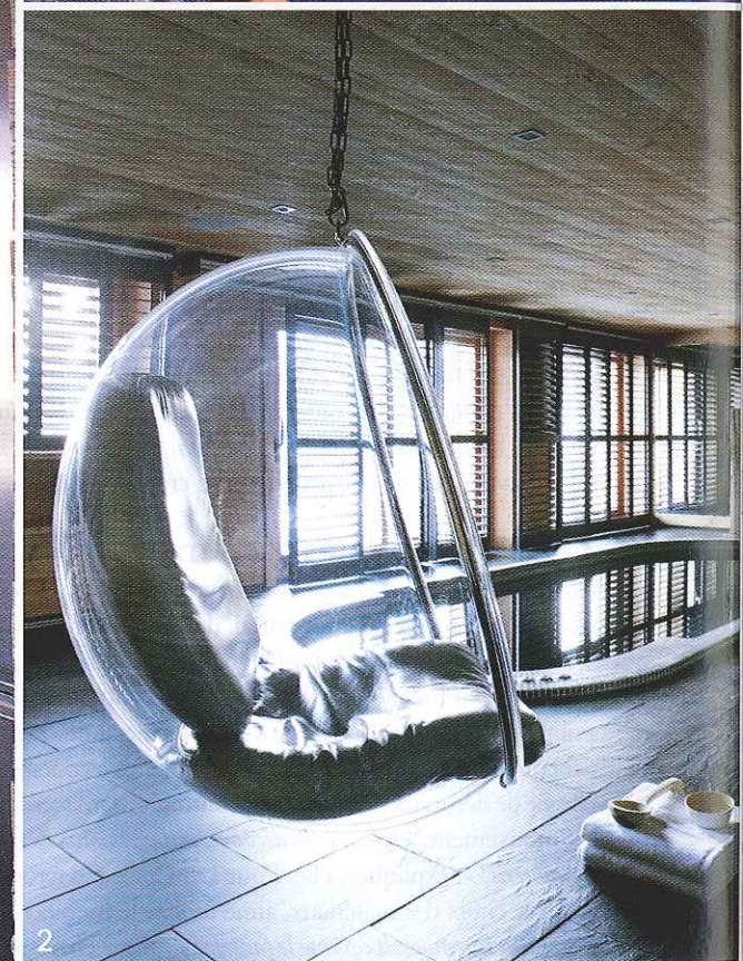
Page de gauche , une fenêtre de métal pour une alcôve de détente avec vue imprenable sur le Montgenèvre. Ci-contre , la cuisine Bulthaup et son plan de travail en Corian se fondent naturellement dans le bois brut, illuminé par des suspensions en verre soufflé Aurore , créations Angélique Buisson pour Angel des Montagnes. 1. La charpente, un travail d'orfèvre. 2. Dans le Spa, les persiennes intérieures coulissantes jouent avec l'ombre et la lumière. Dominant la piscine, la Bubble Chair , signée Aarnio, tout en transparence.