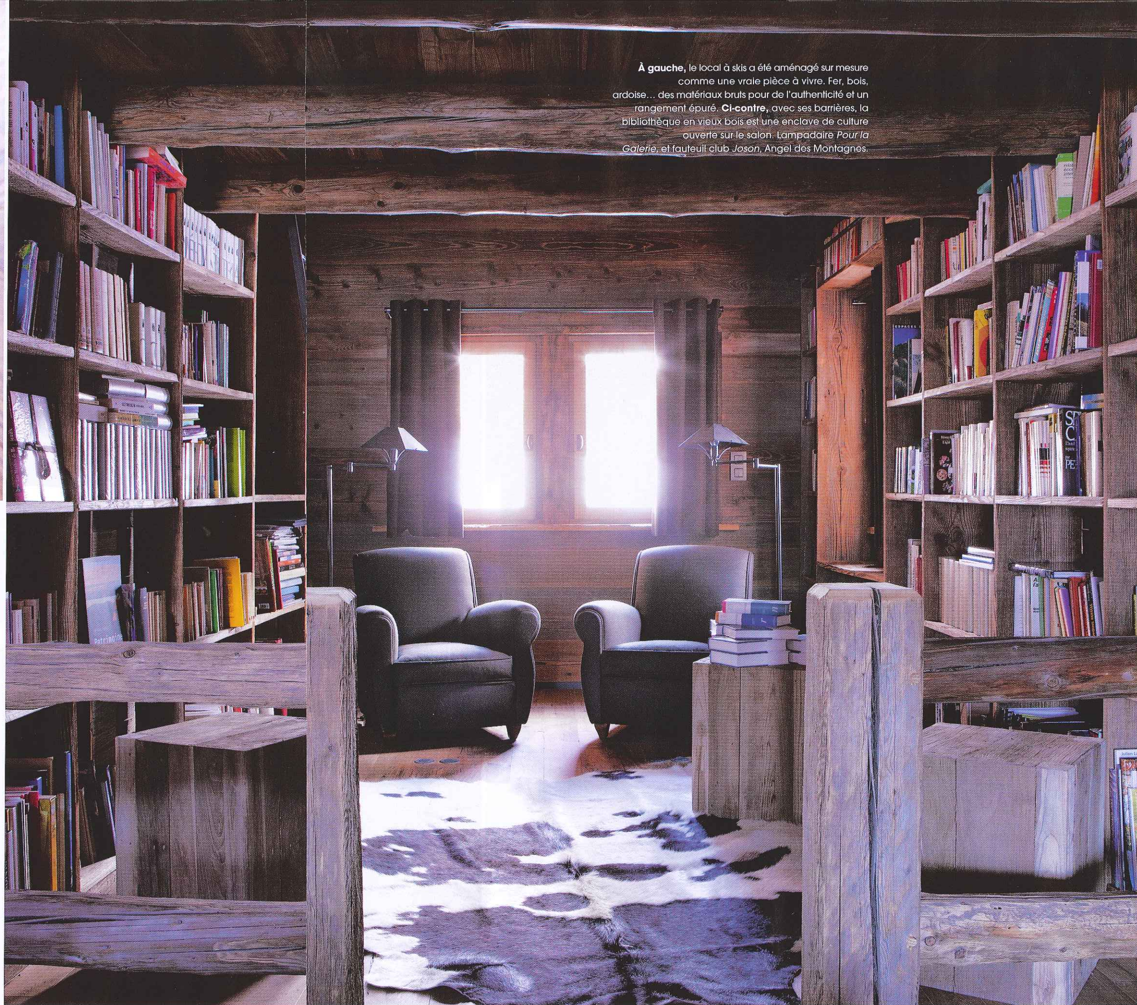
À gauche, le local à skis a été aménagé sur mesure comme une vraie pièce à vivre. Fer, bois, ardoise... des matériaux bruts pour de l'authenticité et un rangement épuré. Ci-contre, avec ses barrières, la bibliothèque en vieux bois est une enclave de culture ouverte sur le salon. Lampadaire Pour la Galerie, et fauteuil club Jozon, Angel des Montagnes.

► nette. Chez nous, les planchers arrivent au ras du mur : pas de plinthe cache-misère. Notre tailleur de pierre italien exploite une carrière à 1300 mètres d'altitude au cœur de la montagne, à 36 mètres de profondeur ! Pour chaque mètre de lauz posé sur le toit, il faut monter 220 kilos de pierre ! » Difficile de se remémorer aujourd'hui l'époque où les tout-puissants architectes des Bâtiments de France interdisaient les chalets de bois – « pas dans l'histoire de la région », – engendrant des générations de constructions en crépis pas terribles !